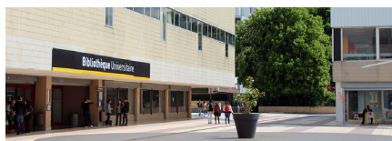
BU SHS (Sciences humaines et sociales) Campus Pont de Bois à Villeneuve d'Ascq

Site web : busante.univ-lille.fr Twitter : @BULilleDS Facebook : @BULSanté Tél. : 03 20 90 76 73 ou 48