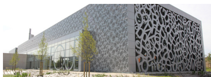
BU Santé Avenue Eugène Avinée à Loos

Site web : budroitgestion.univ-lille.fr Twitter : @BULilleDS Facebook : @BULDroit Tél. : 03 20 90 76 67