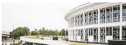
LILLIAD Learning center Innovation Campus Cité scientifique à Villeneuve d'Ascq

Site web : bushs.univ-lille.fr Twitter : @BULilleSHS Tél. : 03 20 41 70 00